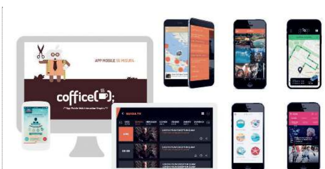
Sviluppo software e app mobile