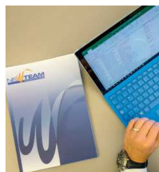
New Team Srl