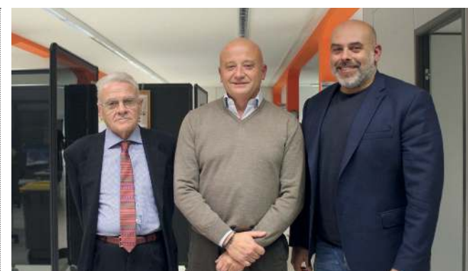
I soci Omigrade